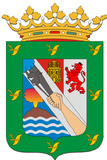
Escudo heráldico municipal (1928).