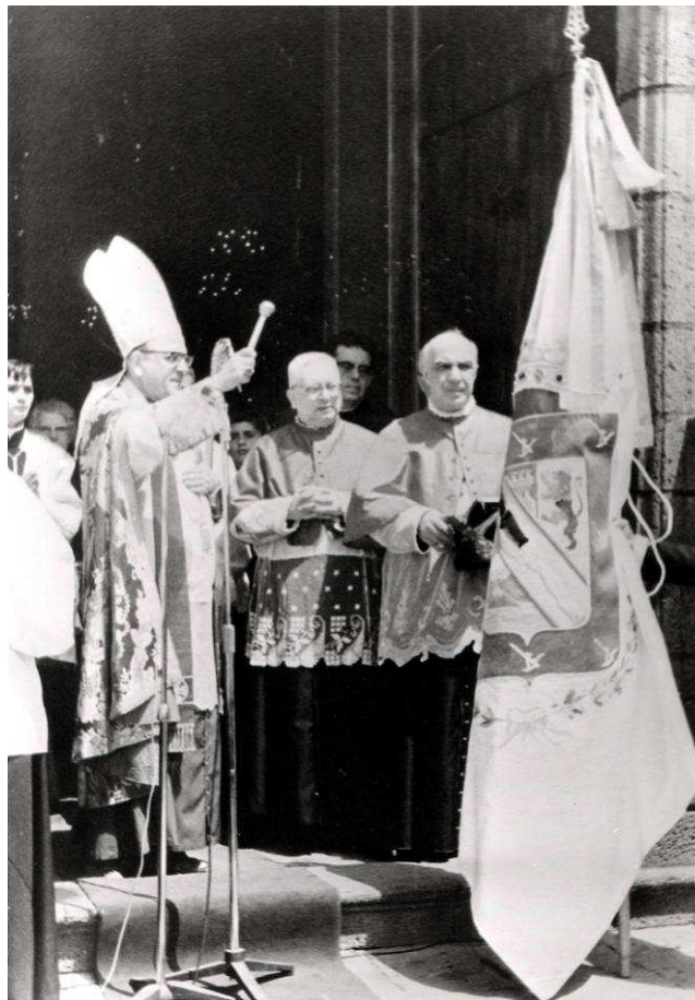
Bendición del Pendón Heráldico de la ciudad de Güímar (1966).