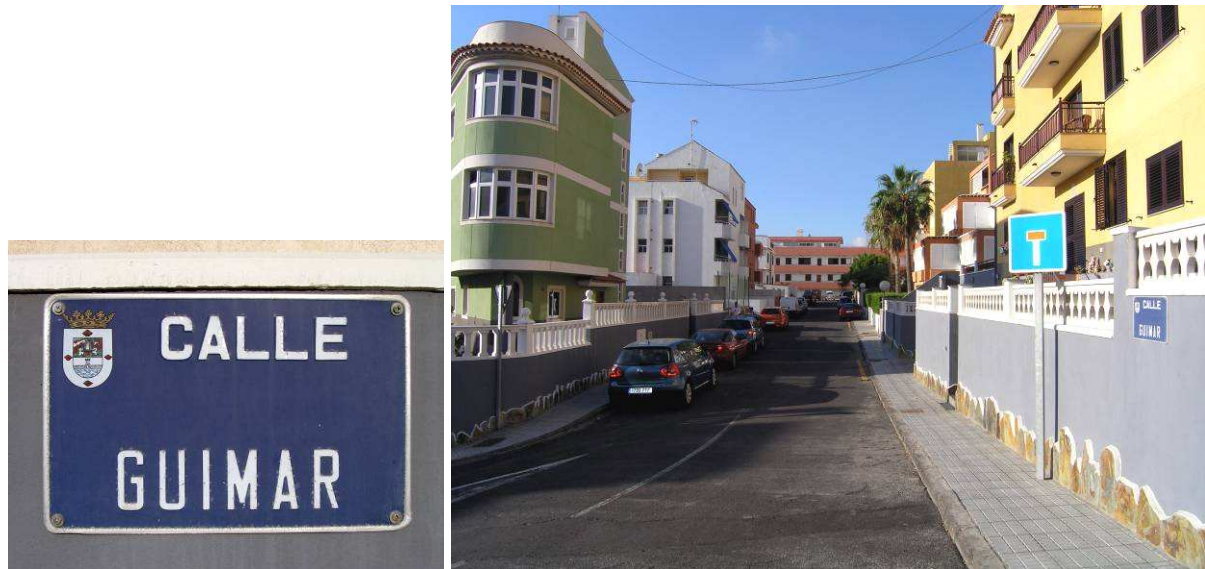
La calle Güímar en Candelaria.

Más reciente que las anteriores, la Corporación municipal de Candelaria dio el nombre de Güímar a una calle del barrio de El Pozo.